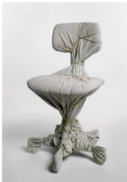
Christo, Verpackter Stuhl, 1978 Sprenkel Museum Hannover