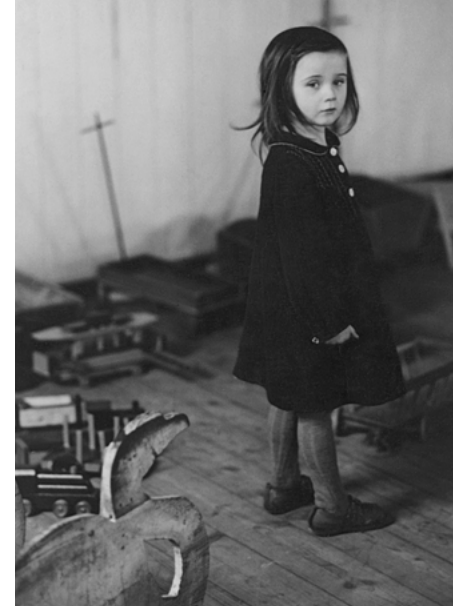
UMBO (Otto Maximilian Umbehrl) Ohne Titel, aus der Serie „THE LOST CHILD“, 1951 Sprenkel Museum Hannover