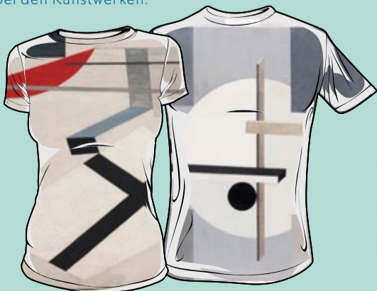
T-Shirt-Motive: El Lissitzky

Kann man einen Picasso anziehen? Oder einen El Lissitzky ins Haar stecken? Das Sprengel Museum Hannover wird zum Modeatelier. Wir entwerfen Sachen zum Anziehen. Ideen dafür holen wir uns bei den Kunstwerken.