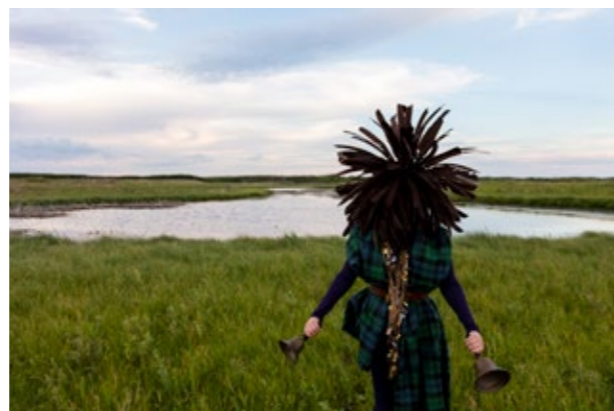
Meryl McMaster, From a Still Unquiet Place, 2019, Digital C-Print, 101,6 x 152,4 cm; Courtesy of the artist, Stephen Bulger Gallery, Pierre-François Ouellette art contemporain

Mit TRUE PICTURES? bietet das Sprengel Museum Hannover einen Überblick über das fotokünstlerische Schaffen in Kanada und den USA ebendieser letzten 40 Jahre. Die große Schau mit Werken von Cindy Sherman, Walead Beshty, Carrie Mae Weems, Jeff Wall, Nan Goldin, Martine Gutierrez und Deana Lawson u.a. nimmt dabei drei aufeinanderfolgende Künstler*innen-Generationen in den Blick, die nicht nur durch den Kontinent und das Medium Fotografie miteinander verbunden sind. Auch der Einzug der Digitalfotografie in das zuvor analog geprägte Medium eint sie.