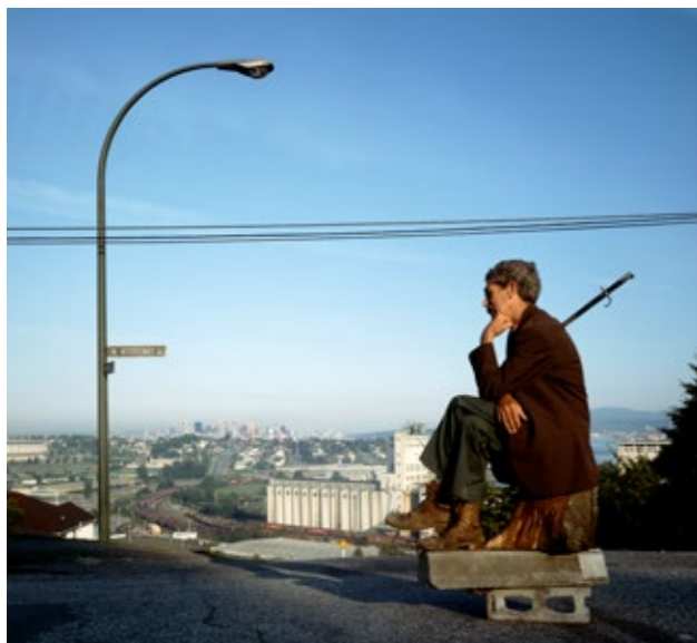
Jeff Wall, The Thinker, 1986, Leuchtkasten / Lightbox, 239 x 216 cm; Courtesy of the artist