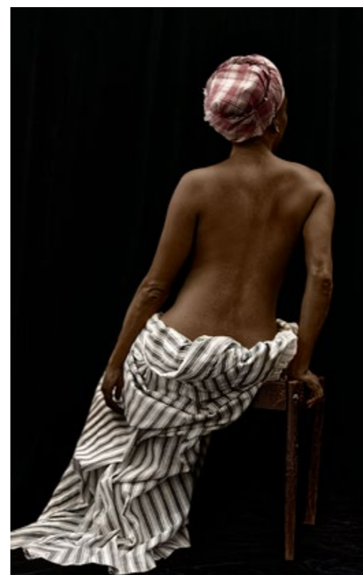
Ayana V. Jackson, Anarcha, 2017, Archival pigment print, 100 x 70 cm; Courtesy of the artist and Mariane Ibrahim

Neben narrativen und politisch aufgeladenen Positionen finden sich in den Arbeiten der jüngeren Künstler*innen subjektive sowie transmediale Ansätze, die Ausdruck der visuellen Kultur des 21. Jahrhunderts sind.