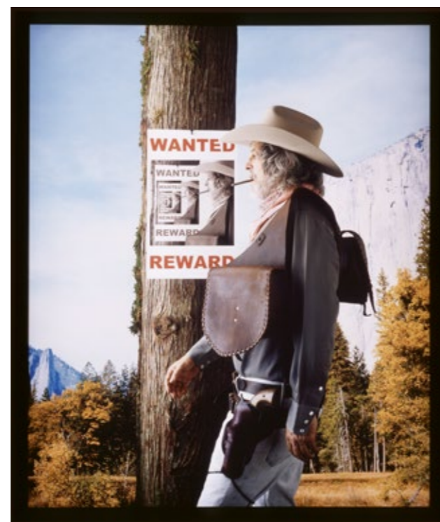
Rodney Graham, Paradoxical Western Scene, 2006, Chromogenic print in lightbox, 147,3 x 121,9 x 17,8 cm