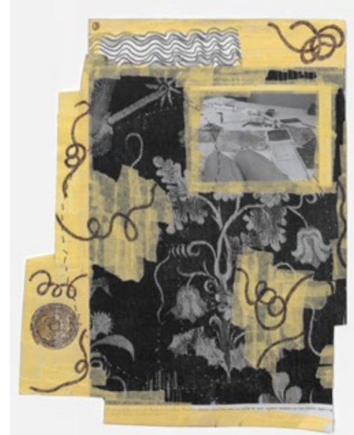
Isabel Nuño de Buen

Beeindruckt hat Nuño de Buens durch ihre eigenwillige Position als Bildhauerin, die verschiedene Kulturen, Medien und Techniken in subtilen, zeichenhaften und skulpturalen Interventionen vereint. Zudem überzeugte ihr Reisekonzept: Im Rahmen ihres Stipendiums hat die Künstlerin eine Reise durch Spanien und Frankreich gemacht, um dort historische Wandteppiche zu besichtigen und die eigene Arbeit in der unmittelbaren Auseinandersetzung weiter zu entwickeln. Isabel Nuño de Buen wurde 1985 in Mexico City geboren, hat an der HBK Braunschweig studiert und lebt in Hannover. Der SPRENGEL PREIS wird gemeinsam mit der Niedersächsischen Sparkassenstiftung und dem Land Niedersachsen vergeben und soll Impulse für den Kulturaustausch in Europa setzen. Katalog 18 €