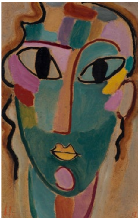
Alexej von Jawlensky