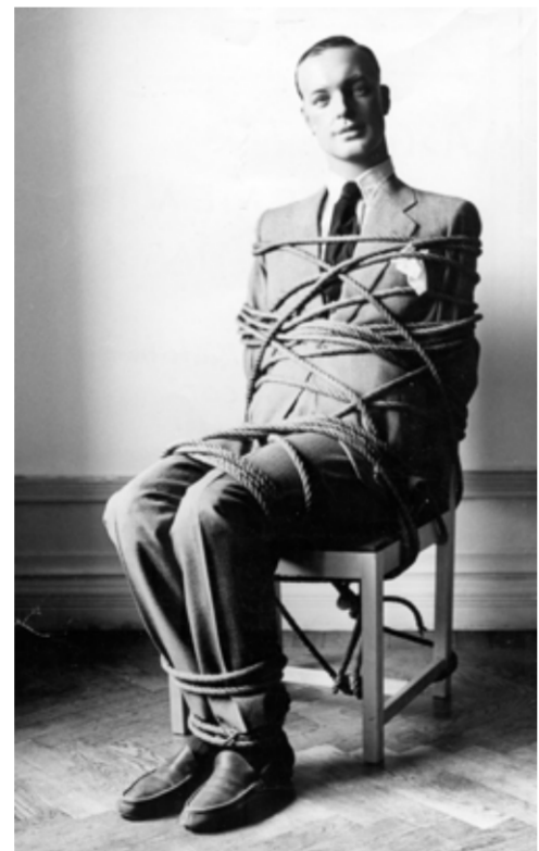
Carl Fredrik Reuterswärd

Erstmals werden die Verbindungen der drei Künstler vorgestellt. Die Ausstellung ist eine Art Versuchsanordnung – wie auf einem Tableau treffen ihre Werke aufeinander. So wird das Gemeinsame sichtbar: Konzept, Ironie, Wortwitz und das Spiel. Reuterswärd, dessen Werk durch eine großzügige Schenkung des Künstlers in der Sammlung des Museums präsent ist, und Fahlström gehören zum Kreis der schwedischen Kunstszene der 1950er- und 60er-Jahre, die neben der Ablehnung des abstrakten Expressionismus die Begeisterung und Verehrung für Duchamp verband. Reuterswärd ist durch Non Violence – ein Revolver mit verknötetem Lauf – vielen vertraut: Die Skulptur steht vor dem New Yorker Hauptquartier der Vereinten Nationen. Die Ausstellung entsteht zusammen mit der Carl Fredrik Reuterswärd Art Foundation.